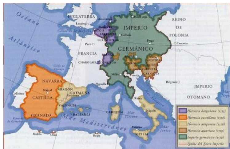
Territorios gobernados por Carlos I.

En el momento de su abdicación decidió repartir sus dominios entre su hermano Fernando (el trono imperial y las posesiones del ducado de Austria) y su Hijo Felipe (los reinos peninsulares, los territorios de Italia, los dominios del ducado de Borgoña, las plazas africanas, y los inmensos territorios, todavía en trance de conquista, de las Indias. Nadie hasta entonces en la historia había dominado tan vasta extensión del mundo.