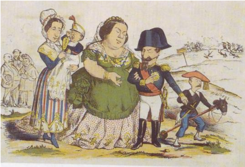
Isabel II, con su hijo, es recibida en Francia por el emperador Napoleón III. Caricatura publicada en La Flaca, agosto de 1869

En septiembre de 1868 se preparó el pronunciamiento que tendría lugar en Cádiz. El día 18 el almirante Topete se sublevaba en Cádiz, ante la presencia de Prim, señaló con sus cañones el destronamiento de la reina. El manifiesto o proclama dado a conocer el día 19, Proclama de Prim , finalizaba con el grito de Viva España con honra , símbolo de esta revolución del 1868, conocida como la Gloriosa. El triunfo del general revolucionario en Alcolea (Córdoba) supuso la caída de Isabel II y su salida de España. Comenzaba el Sexenio Democrático (1868-1874).