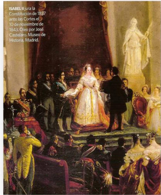
ISABEL II jura la Constitución de 1837 ante las Cortes el 10 de noviembre de 1843. Óleo por José Castelar. Museo de Historia, Madrid.

Espartero, como muchos progresistas, era partidario del libremercado. Lo primero que hizo fue rebajar los aranceles, hasta el punto de que la mitad de los productos de importación quedaban gravados en un 15 por 100, en lugar del 30 ó 40 que regía antes. Las pañerías catalanas se hundieron, y lo mismo sucedió en la naciente industria malagueña; numerosas fábricas hubieron de cerrar, y sus hombres se encontraron en la calle. La protesta de los industriales fue inmediata, sobre todo, en Cataluña. Pronto Barcelona apareció en abierta rebelión. Comenzaban los primeros intentos de asociaciones de trabajadores, y la revuelta cobró un claro carácter social (1842). Espartero hizo bombardear Barcelona desde el castillo de Montjuich, y la ciudad se entregó; pero la indignación creció aún más. Pronto se alzaron otras ciudades: Reus, Valencia, Alicante, Sevilla... en un movimiento que dirigía una coalición de moderados y progresistas descontentos. En el verano de 1843 el regente vio perdida la situación y emigró a Inglaterra. En medio de un profundo desprestigio finaliza el mandato de Espartero, lo que obligó a adelantar la mayoría de edad de la reina.