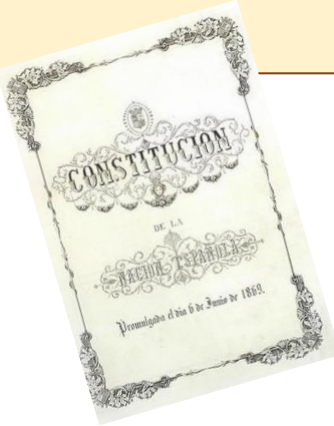
Artículo 33.- La forma de Gobierno de la Nación española es la Monarquía .